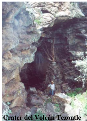
Crater del Volcán Tezontle

El Fértil Valle del Río Poanas ocupa el centro de sus terrenos, la región Poniente, está cubierta por lava basálticas que constituyen la verdadera breña abrupta y áspera pero grandiosa en su conjunto llena de grietas y quiebras a través de colinas, siendo visibles diversos conos; en este particular paisaje. se encuentra el hermoso Cerro de Martín Pérez; El “Maika dos”, “El Coyonqui” y el “Fraile”(Volcanes), este último sirve de limite para los municipios de Nombre de Dios, Poanas y Durango. Al Noreste se encuentra la sierra de “Santa María”, Cordillera bastante alta que se prolonga hacia el sur formando la cadena del “Sacrificio” y “Papantón” Al norte en la misma sierra de Santa María se eleva el “Cerro de la Poana” o Puana, y el volcán “Maika uno”, entre otras montañas que se extienden hasta la sierra de Cieneguilla al Noroeste del municipio, donde se encuentra el volcán “Tezontle”.